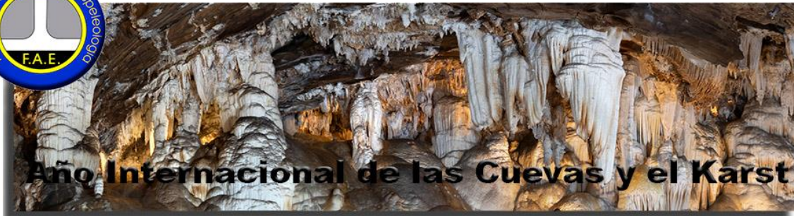
Gruta de las Maravillas (Aracena)

El 26 de enero, se llevó a cabo la presentación oficial de esta iniciativa de la Unión Internacional de Espeleología , la cual cuenta con el apoyo de la UNESCO.