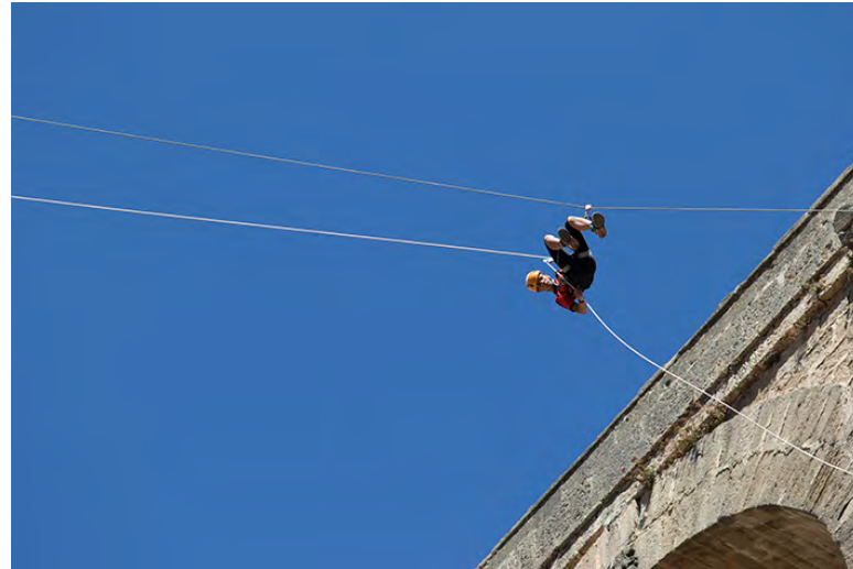
Rappel guiado en la salida desde el Parador de Turismo

Campeonato Mundial de Técnicas de Espeleología Campeonato Mundial de Descenso de Cañones Campeonato Andaluz de TPV en Espeleología Encuentro Nacional de Grupos de Espeleosocorro Congreso Internacional de Espeleología y Cañones Simposio de Fotografía Espeleológica Certamen Internacional de Fotografía Espeleológica y Cañones Exposición de Fotografía y Pintura de Cavernas Subterráneas Exposición del Museo de la Espeleología y Centro de Documentación "Jordi Lloret"