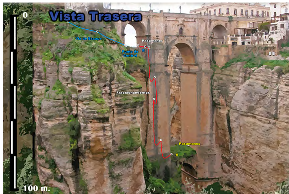
Croquis instalación circuito cuerdas en cara Sur Puente Nuevo

Una vez en la base del puente, y a través de un pasamanos, se dirigirán a la cara posterior del citado pilar, para volver a ascender utilizando las técnicas de progresión vertical en espeleología, con varios tramos fraccionados, hasta alcanzar el ojo del puente en ese lateral, y volver a salir a la cara principal del Puente Nuevo.