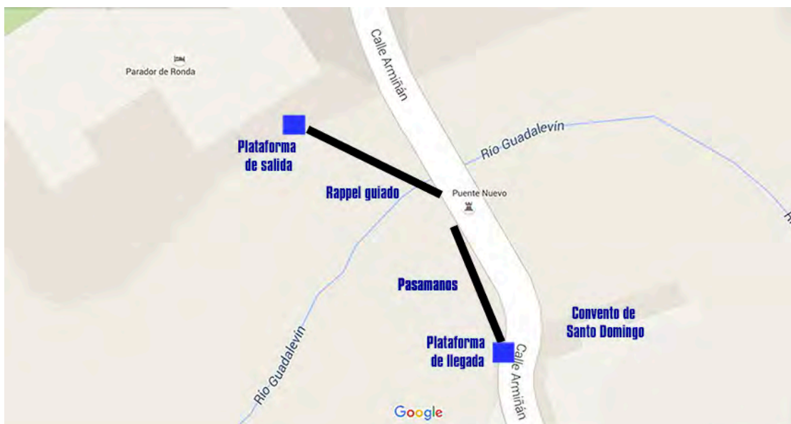
Croquis del recorrido

El inicio de este circuito comenzará con un gran rappel guiado desde una plataforma ubicada en el Paseo de Kazunori Yamahuchi junto al Parador de Turismo, descendiendo por un rappel guiado cuya cabecera estará anclada a una plataforma tubular de 4,00 x 2,00 x 4,00 metros (largo x ancho x alto) que junto con sus contrapesos tendrá unos cabos de afianzamiento de seguridad a las columnas del edificio del propio Parador de Turismo, a altura suficiente y con espacio útil libre para dejar paso a los transeúntes.