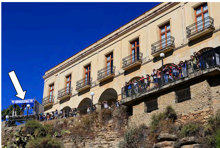
Plataforma de salida junto Parador de Turismo

Campeonato Mundial de Técnicas de Espeleología Campeonato Mundial de Descenso de Cañones Campeonato Andaluz de TPV en Espeleología Encuentro Nacional de Grupos de Espeleosocorro Congreso Internacional de Espeleología y Cañones Simposio de Fotografía Espeleológica Certamen Internacional de Fotografía Espeleológica y Cañones Exposición de Fotografía y Pintura de Cavernas Subterráneas Exposición del Museo de la Espeleología y Centro de Documentación "Jordi Lloret"