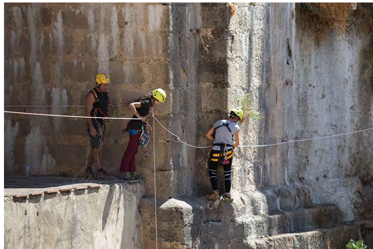
Pasamanos en Puente Nuevo

Por el lateral derecho del Puente bajarán hasta su base para volver a subir otro tramo de 90 metros, y ascender por un pasamanos por la cornisa hasta la plataforma de meta en la calle Armiñán delante del Convento de Santo Domingo.