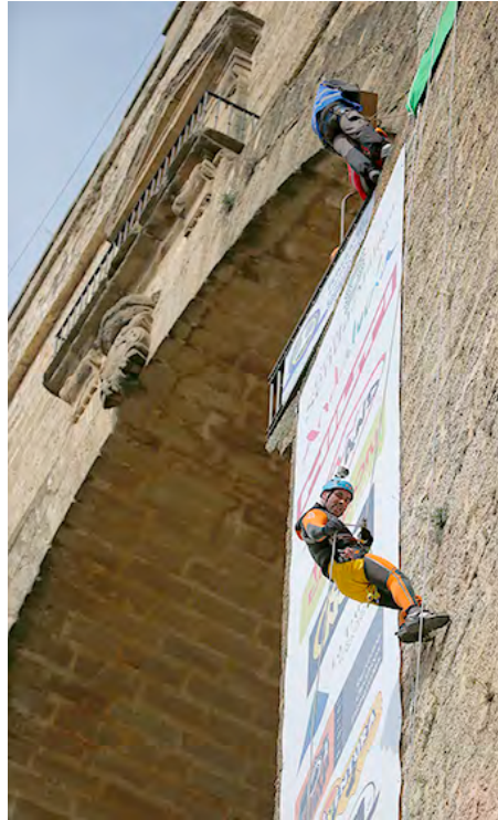
Descenso por el Puente Nuevo

Campeonato Mundial de Técnicas de Espeleología Campeonato Mundial de Descenso de Cañones Campeonato Andaluz de TPV en Espeleología Encuentro Nacional de Grupos de Espeleosocorro Congreso Internacional de Espeleología y Cañones Simposio de Fotografía Espeleológica Certamen Internacional de Fotografía Espeleológica y Cañones Exposición de Fotografía y Pintura de Cavernas Subterráneas Exposición del Museo de la Espeleología y Centro de Documentación "Jordi Lloret"